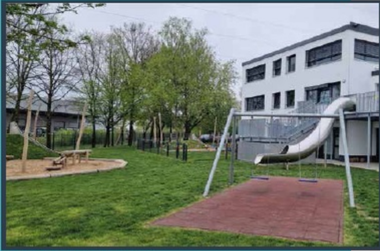
Außenansicht Kita Wiesenwichtel

Neue Kita, neuer Bauhof und viel Platz für Vereine.