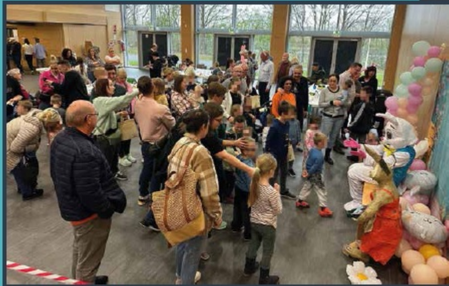
Impression Osterzauber 2024

Auch im kommenden Jahr plant die CDU Windhagen wieder einen Osterzauber für Familie. Bis dahin, Ohren steif halten und den Karsamstag im Terminkalender freihalten!