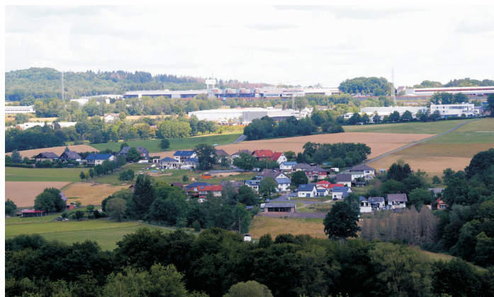
Blick auf Windhagen, im Vordergrund OT Hallerbach

Neue Wege gehen. Gutes und Bewährtes erhalten.