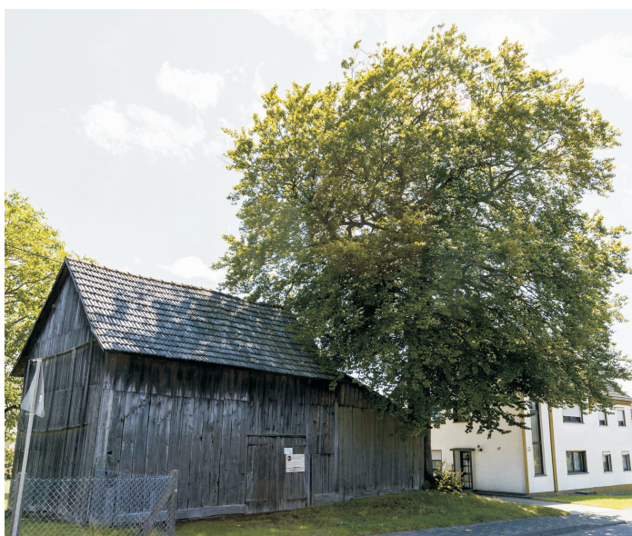
Diese wunderschöne alte Buche steht in Stockhausen im Oberdorf. Sie prägt allein schon wegen ihrer imposanten Höhe die gesamte Optik ihrer Umgebung.