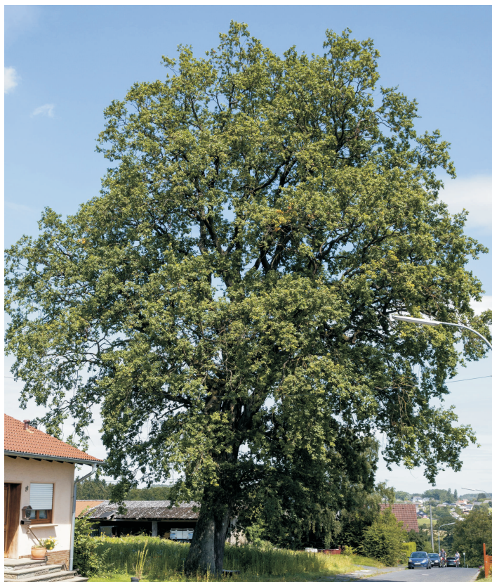
Die wohl älteste Eiche in der Gemeinde. Durch Blitzschlag geschädigt, aber wieder saniert, ein beeindruckendes Naturdenkmal. Zu sehen in der Ringstrasse in Stockhausen.

Mit dem "100 Bäume Programm" in unserer Ortsgemeinde streben wir eine Vervielfältigung dieser positiven Faktoren an. Gesunde Luft und ein nachhaltiges Naturbild in unseren Ortsteilen ist ein großer Gewinn an Lebensqualität.