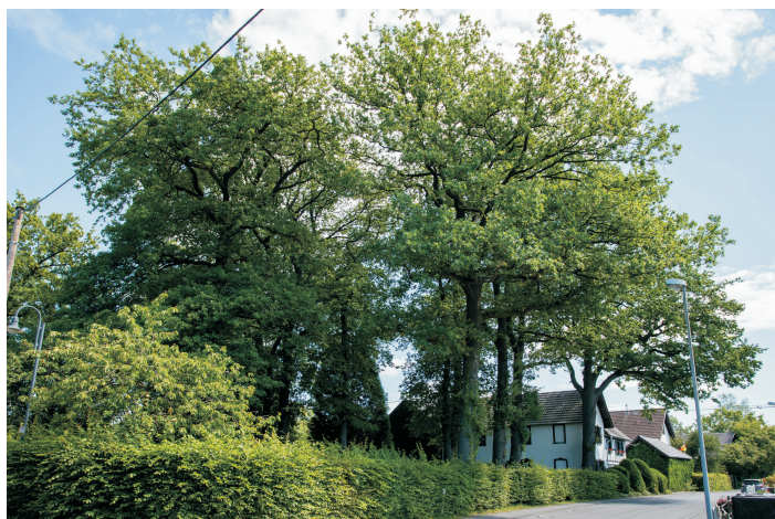
In Rederscheid gehört das stattliche Ensemble der alten Eichen zum festen Inventar der Natur. Mitten im Ort, eine Bereicherung für alle Rederscheider.

Wir sollten alles tun, um diese Oasen der gewachsenen Natur zu bewahren. Um so mehr, als es doch die Bäume sind, denen man eine der wichtigsten Funktionen zur Schaffung eines ausgeglichenen Kleinklimas zuordnet.