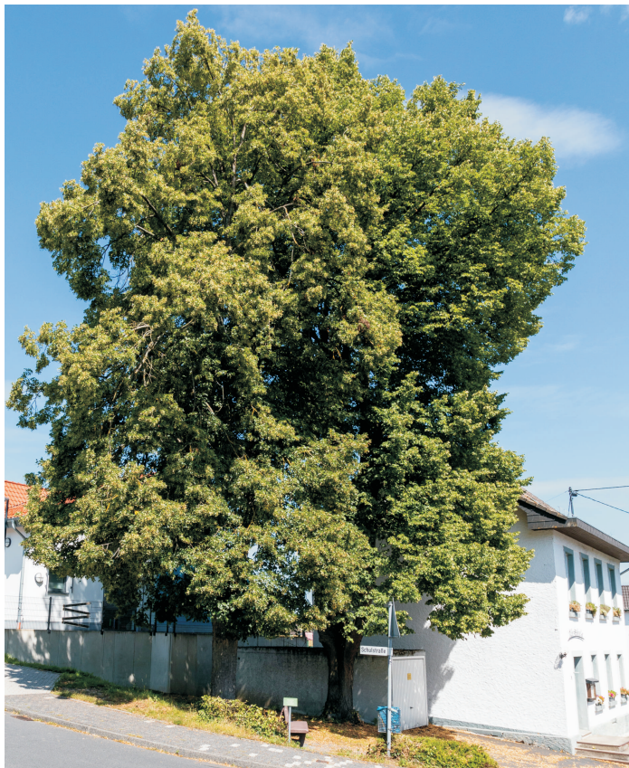
Vor der Fällung bewahrt, die Linden an der alten Schule. Ein lebendiges Stück Heimat im Ortskern. Schön fürs Auge und wertvoll für das Kleinklima.

Mit dem "100 Bäume Programm" in unserer Ortsgemeinde streben wir eine Vervielfältigung dieser positiven Faktoren an. Gesunde Luft und ein nachhaltiges Naturbild in unseren Ortsteilen ist ein großer Gewinn an Lebensqualität.